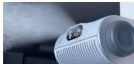
Luftbefeuchter mit Hochdruck-Düsen sind wartungsarm und verbrauchen wenig Energie

Condair Systems GmbH Nordportbogen 5 22848 Norderstedt Telefon: +49 40 853277-0 Telefax: +49 40 853277-44 E-Mail: info@condair-systems.de Internet: www.condair-systems.de