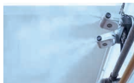
Luftbefeuchter sichern eine störungsfreie Produktion