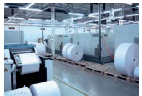
EPDB ist spezialisiert auf das Drucken von Rechnungen

Seit 2019 ist das System DRAABE TurboFog Neo im Einsatz. Für das zur Magyar Posta gehörende Unternehmen sind Kostensenkungen und Qualitätssicherung die wichtigsten Vorteile der geregelten Luftfeuchte.